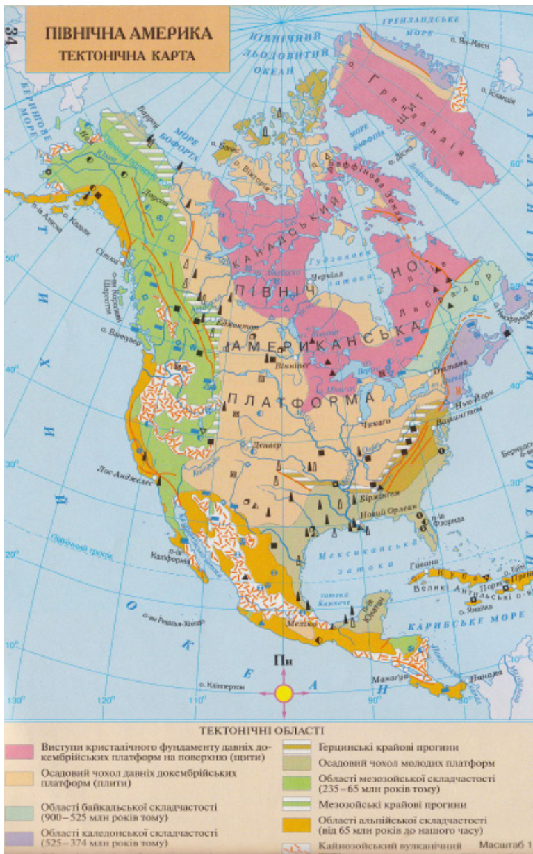
Картографічні зображення з атласу «Географія. Материк і океани» видавництва «Картографія»