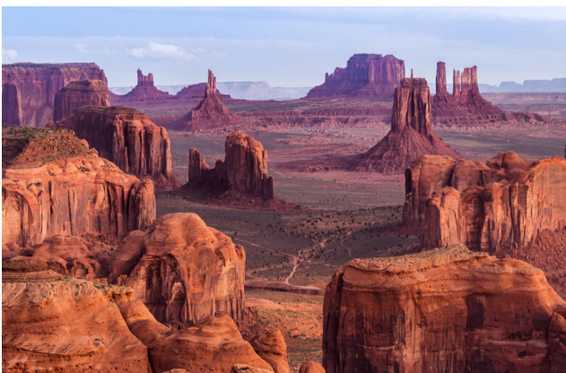
Долина монументів – унікальне геологічне утворення, результат вивітрювання (Аризона, США)