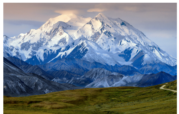
Гора Деналі (Мак-Кінлі)

В основі материка — давня платформа, тому в рельєфі переважають рівнинні форми. Рівнини оточені гірськими хребтами: на заході — високими й сейсмічно активними Кордильєрами, на сході — зруйнованими та невисокими Аппалачами. На рельєф північної частини значно вплинуло давнє зледеніння.