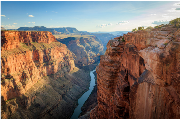
Національний парк «Гранд-Каньйон» (долина річки Колорадо, США)