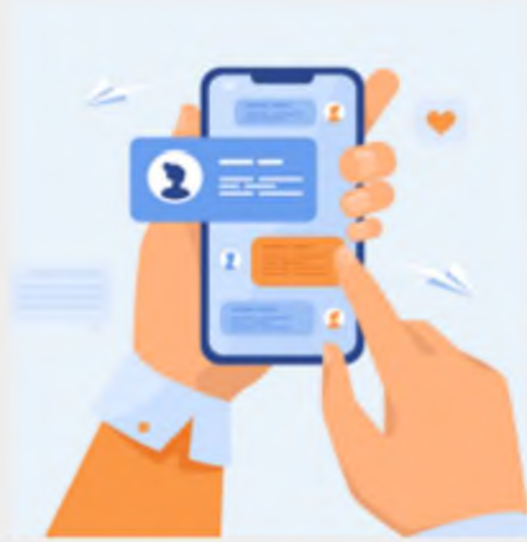
ЧАТИ ТА ГРУПИ

Діти охоче долучаються до чатів і груп, але важливо попередити їх стосовно небезпеки спілкування із незнайомими людьми.